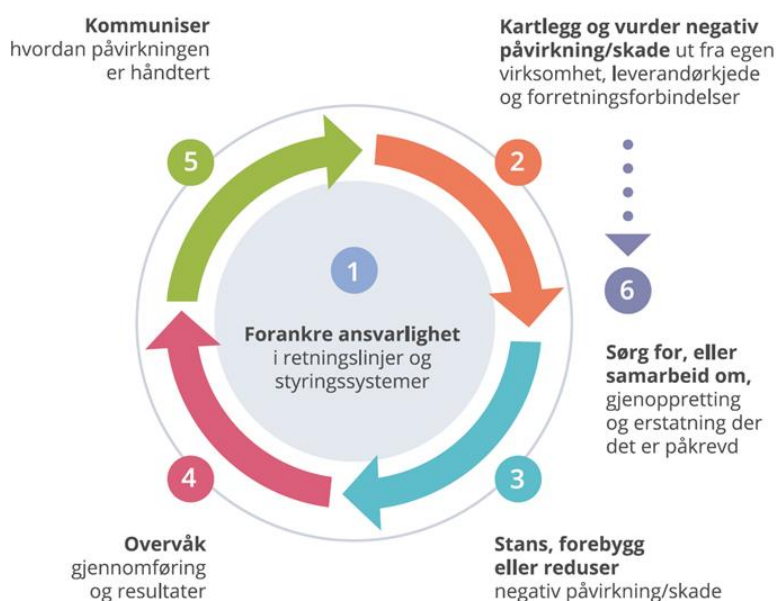
Figur: OECDs kontaktpunkt

Aktsomhetsvurderinger utføres i tråd med OECDs retningslinjer for flernasjonale selskaper, som innebærer en 6-stepsprosess.